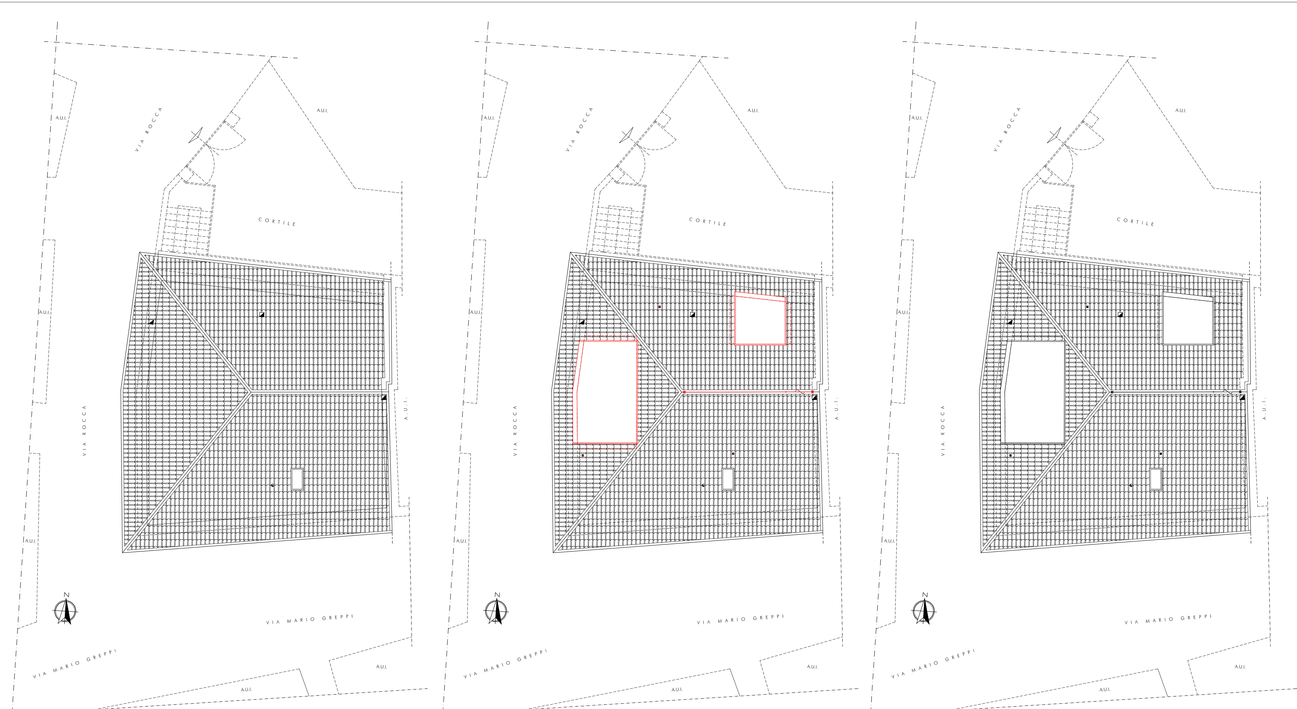
PLANIMETRIA GENERALE - STATO DI FATTO