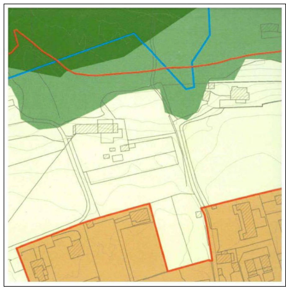
ESTRATTO DI P.G.T. COMUNE DI ANGERA RAPP. 1:2000