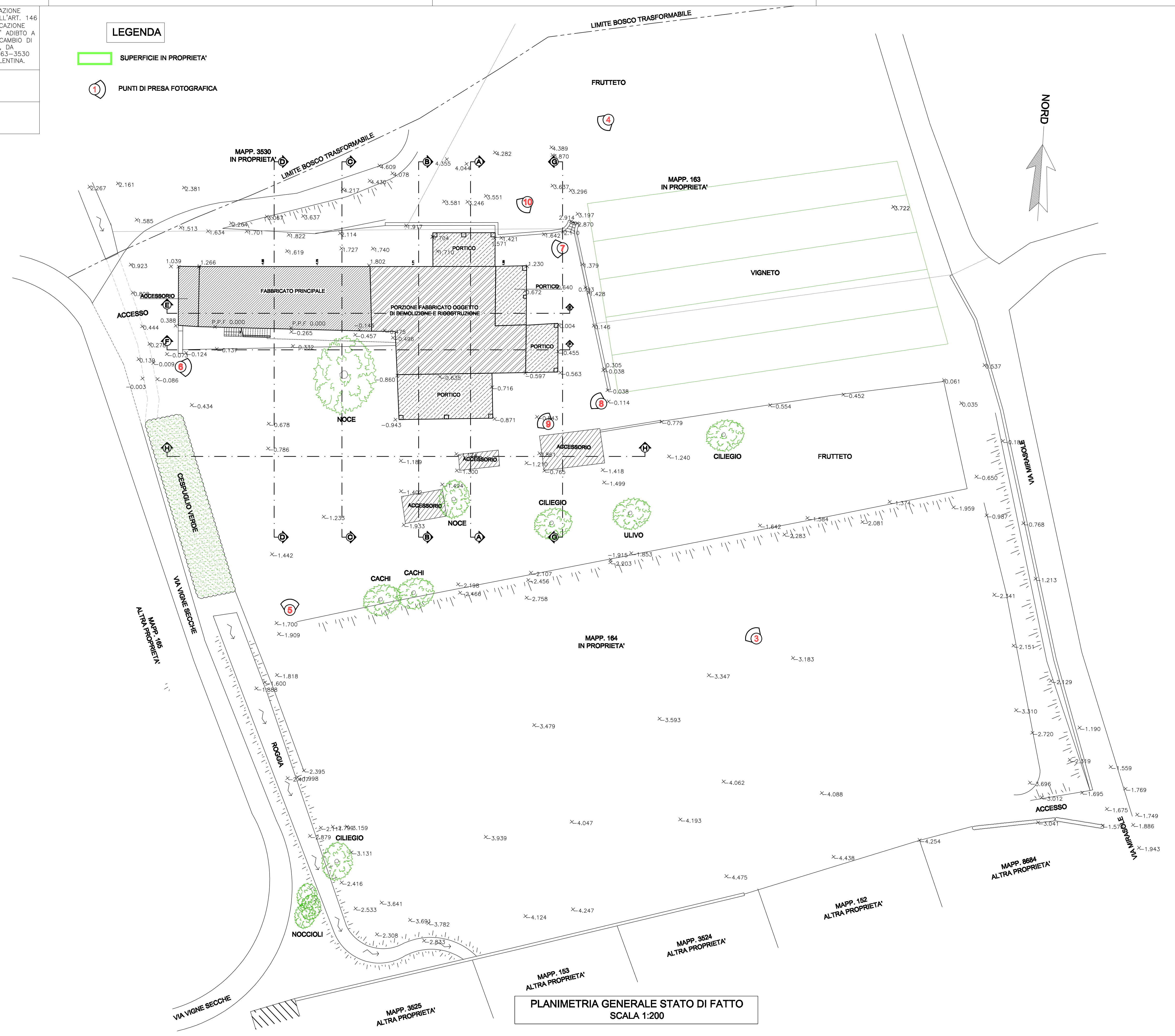
PLANIMETRIA GENERALE STATO DI FATTO SCALA 1:200