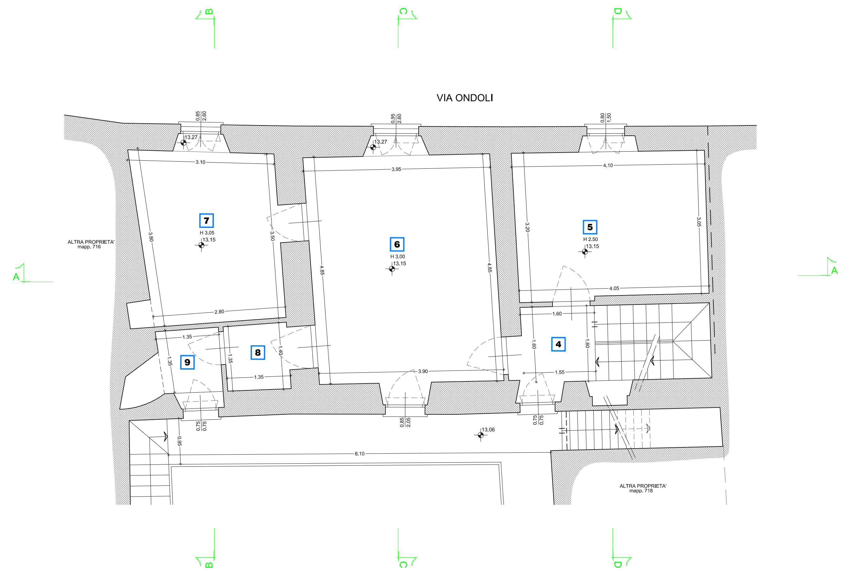
PIANTA PIANO PRIMO PROGETTO scala 1 : 50