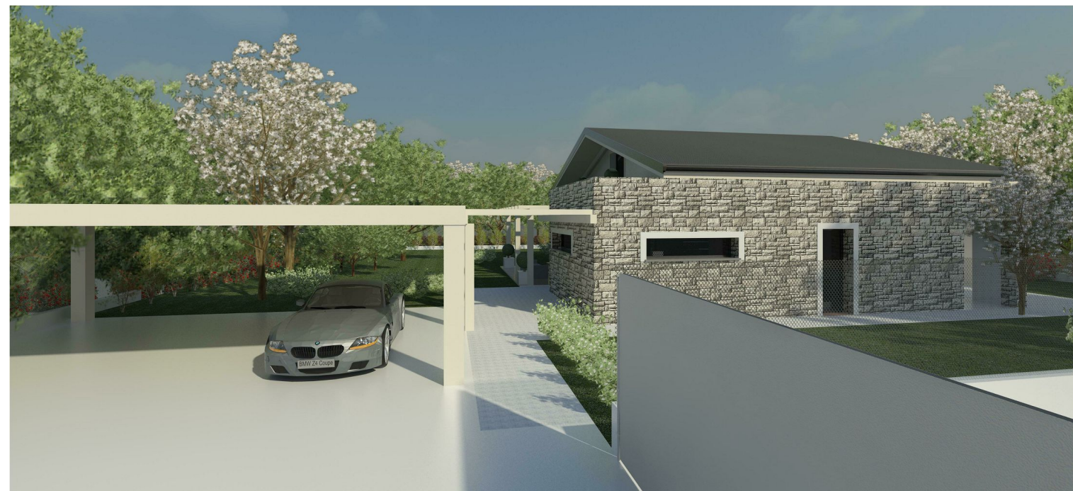
RENDER FRONTE NORD-EST