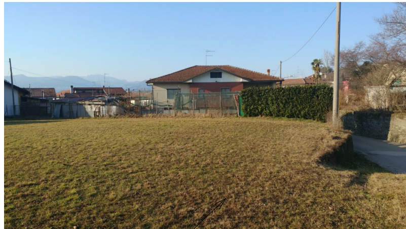
FOTO VERSO OVEST