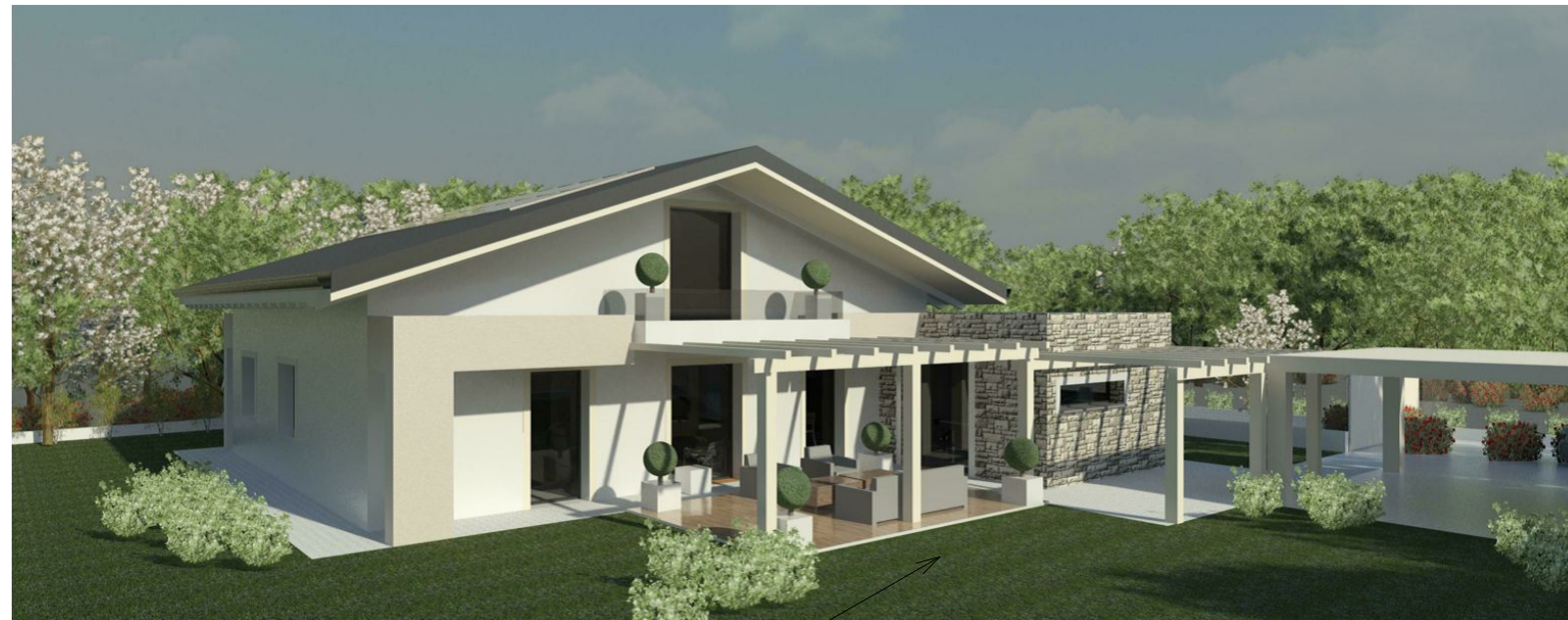
RENDER FRONTE SUD-EST