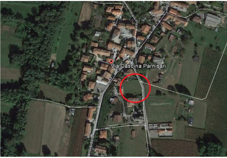
ESTRATTO GOOGLE EARTH