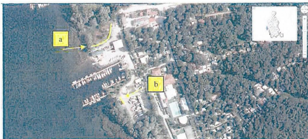
Figura n.2: localizzazione delle barriere verdi